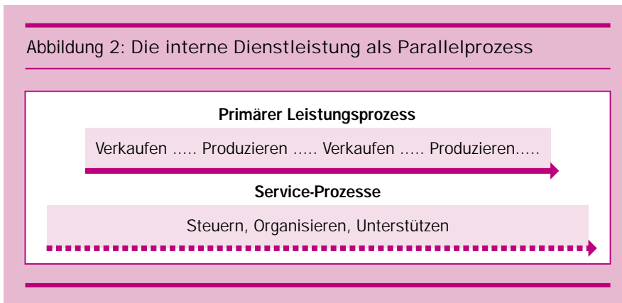
Abbildung 2: Die interne Dienstleistung als Parallelprozess

gen interner Dienstleister tragen zur Steuerung des Unternehmens bei und bedeuten einen Wissensschatz, der zu den strategischen Erfolgsfaktoren (Kernkompetenzen) gehört. Die internen Dienstleister haben damit – ausgesprochen oder nicht ausgesprochen – einen strategischen Auftrag, der für den Unternehmenserfolg immer wichtiger wird.